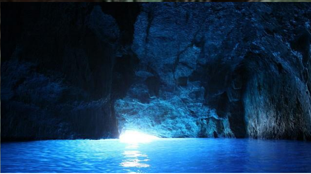
Φαράγγι που οδηγεί σε λίμνη ή στη θάλασσα