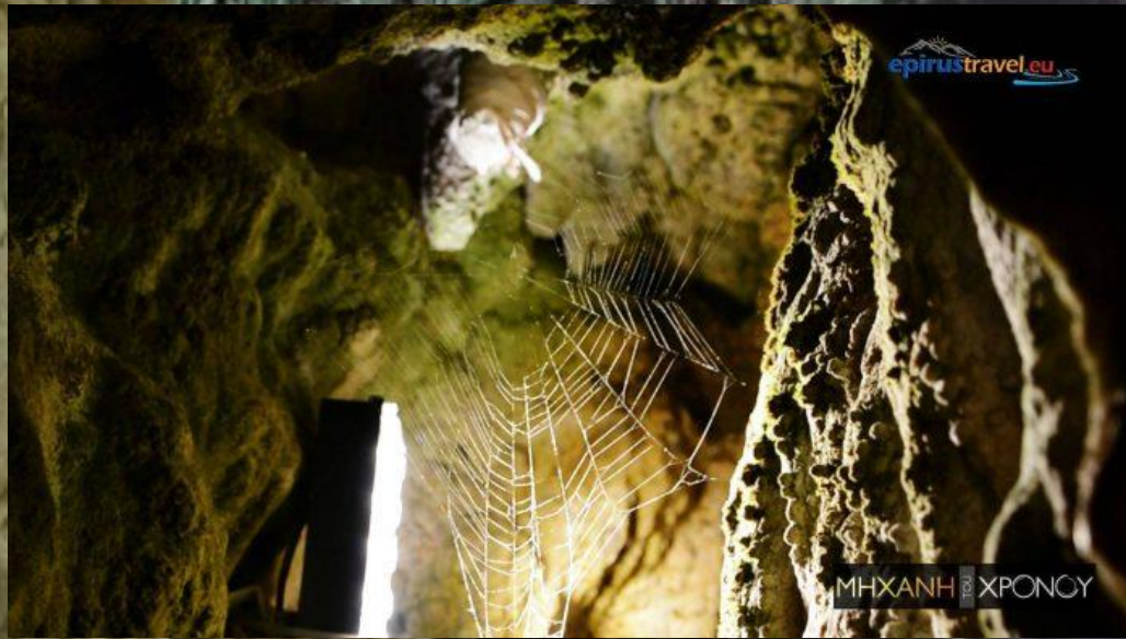
Αράχνες και ιστούς