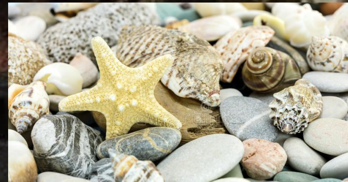
Πέτρες, βότσαλα, κοχύλια, αχιβάδες, αχινούς