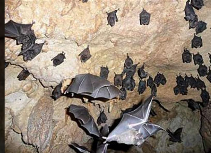
Κοπάδι ή σμήνος νυκτερίδων