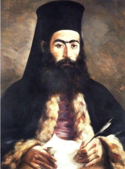
Εικ.1- Ο Αρχιεπίσκοπος Κύπρου Κυπριανός